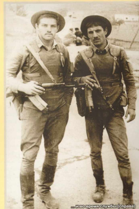
...и во время службы (справа)