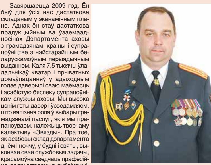
Буйноўскі Сяргей Аляксандравіч, начальнік Дэпартамента аховы МУС Рэспублікі Беларусь папкоўнік міліцыі.