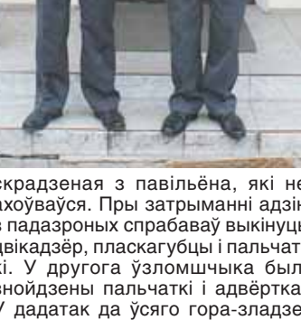
Скрадзеныя з павільёна, які не ахоўваўся. Пры затрыманні адзін з падазронах спрабаваў выкінуць цыкадзёр, плашкагубы і пальчаткі. У другога ўзломчыкі былі знойдзеныя пальчаткі і адвёртка.

У дадаток да ўсёго гора-зладзеі знаходзіліся ў стане алкагольнага ап'янення і старанна спрабавалі адмаўляць сваё дачыненне да сумак, якія самотна лжалі на дароце. У дачыненні да затрыманых узбуджана крмынальная справа па арт. 205 ч. 2 КК Рэспублікі Беларусі.