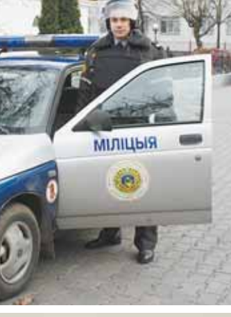
Сяржант міліцыі Віктар ДЗЕРАНЧУК і прапаршчык міліцыі Сяргей ВАШАНЧУК.

Малодшы сяржант Дамітрый ТАРАЗЕВІЧ, старшы сяржант міліцыі Вячаслаў СВІРЖЭЎСКІ.