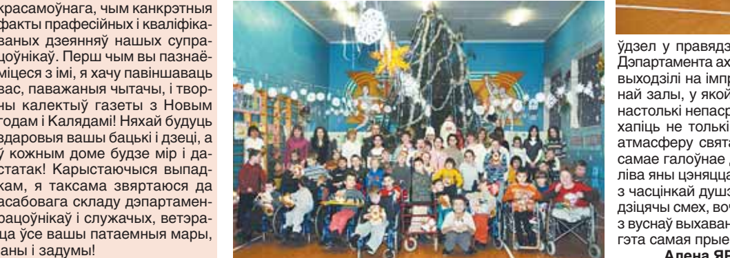
Удзел у правядзенні свята ўзялі дзеці супрацоўнікаў Дэпартамента аховы. У вобразаз казачных героюў дзеці выходзілі на імпровізаваную сцэну ўтульнай спартыўнай залы, у якой устаўлялася ёлка. Выступоўцы былі настолькі непасрэднымі і перакананымі, што змелі захапіць не толькі маленькіх глядачоў, але і перадаць атмасферу свята і вяселосці выхавальнікам. І ўсё ж, самае гаюўнае для дзяцей — гэта падарункі. А асабліва яны цягнулі тады, калі дзеці атрымлівалі іх разам з часцінкай душоўнай целыні і шчырай увагі. Вясёлы дзіцячы смех, вочы, поўныя радасці, і гучнае «дзякуй!» з вуснаў выхаванцаў Івянецкага дома-інтэрната — ці не гэта самая прыемная ўзаемная ўзаагарада?

У рамках пераднавагодняй акцыі «Мары збываюцца», якая праводзіцца па ўсёй рэспубліцы Дэпартаментам аховы МУС Беларусі, супрацоўнікі цэнтральнага апарату вырашылі наладзіць невялікі сюрпрыз выхаванцам Івянецкага дома-інтэрната для дзяцей-інвалідаў з асаблівасцямі фізічнага развіцця. Сярод 63 дзяцей, якія жывуць тут, 39 з'яўляюцца круглымі сіротамі, таму да любой правы ўвагі яны ставяцца вельмі эмацыянальна і з удзячнасцю. Канцэртная праграма была насычаная вясёлымі конкурсамі, музычнымі і танцавальнымі нумарамі, прадстаўленнем ляльчэнага тэатра, сустрачай з гаюўнымі навагоднімі персанажамі — Дзедам Марозам і Снягуркай і, безумоўна ж, не абшлось без падарункаў. Варта адзначыць, што актыўны