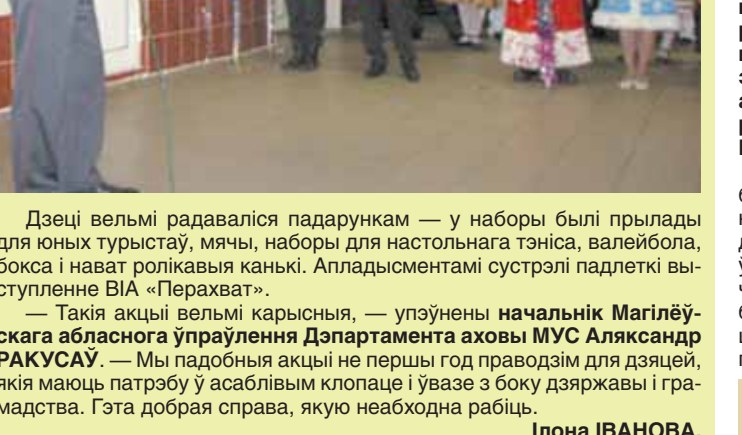
Дзеці вельмі радаваліся падарункам — у наборы былі прылады для юных турыстаў, мячы, наборы для настольнага тэніса, валејбола, бокса і нават ролікавыя канькі. Апладыстамента сустрапі падлеткі выступленне ВІА «Перахват».