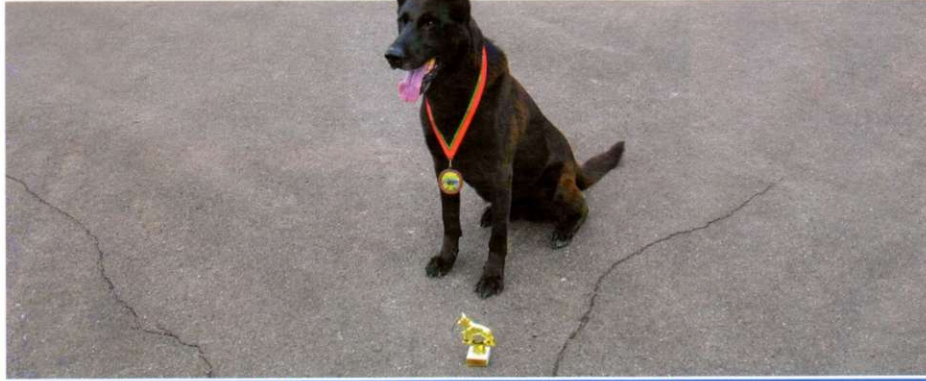
Кацо-победитель: «Не потопашь - не полопашь!»