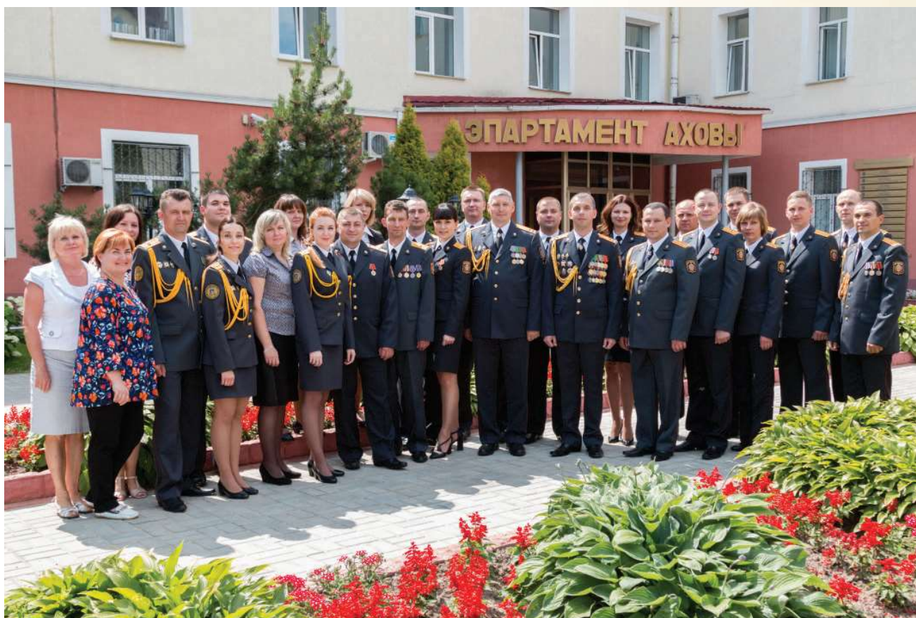
Служебный коллектив УОДПКУИГ