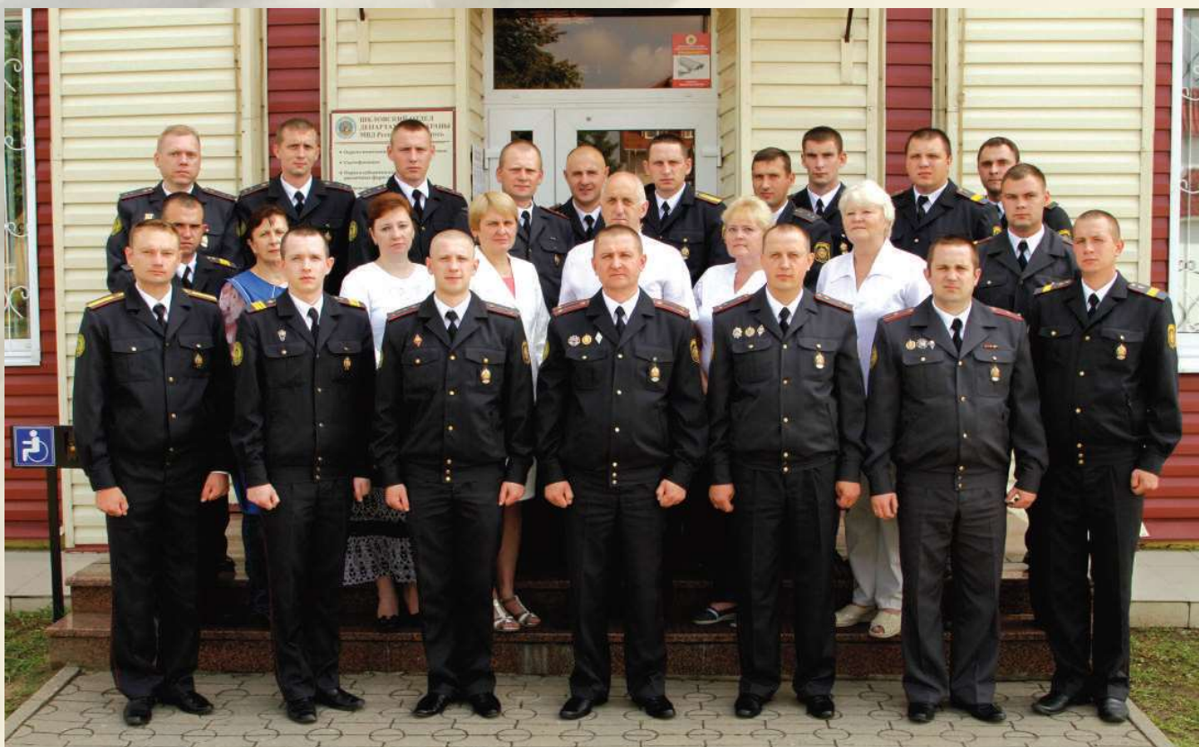
Служебный коллектив Шкловского ОДО