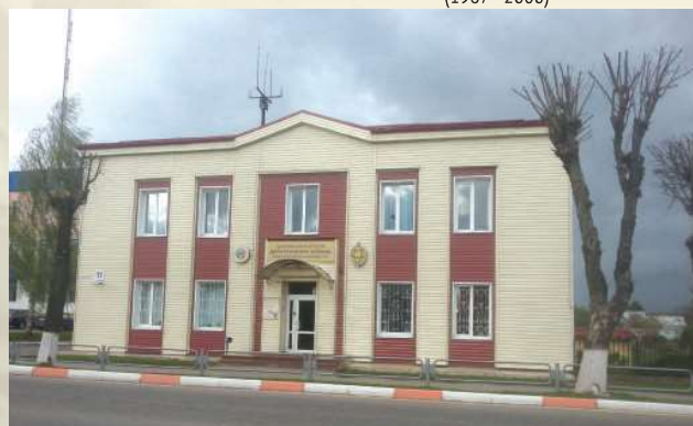
г. Шклов, ул. Советская, 53 (с 2000 г.)