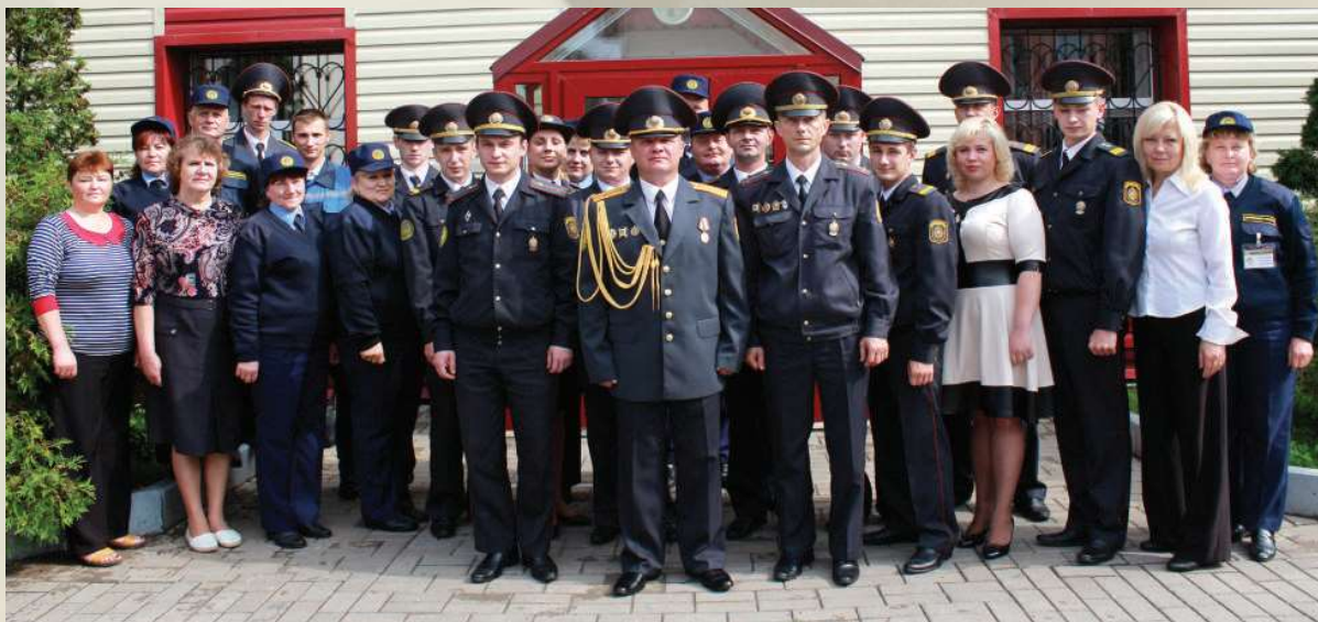
Служебный коллектив Чаусского ОДО