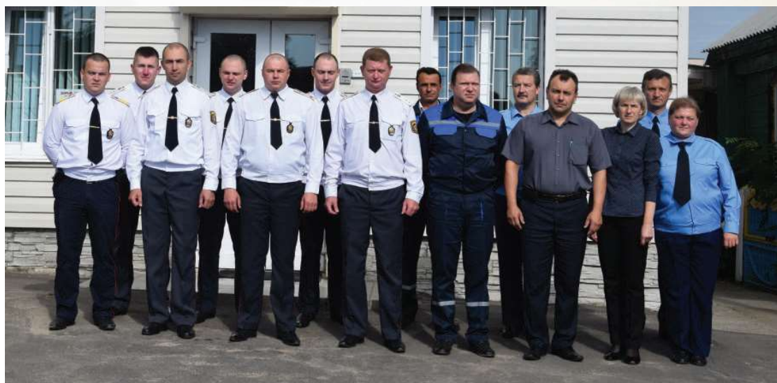
Служебный коллектив Чериковского ОДО