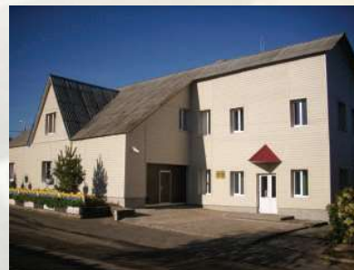
г. Чериков, ул. К. Маркса, 36