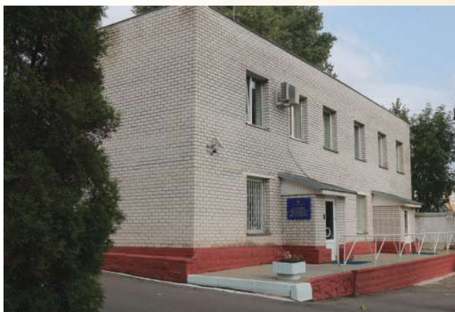
г. Минск, ул. Грушевская, 7а