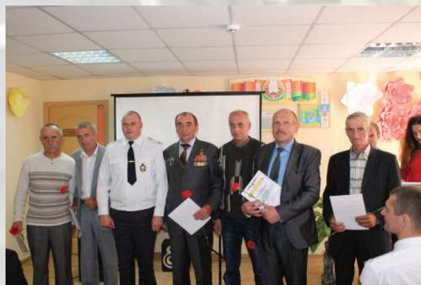
Торжественное мероприятие, посвященное 50-летию со дня образования Чериковского ОДО