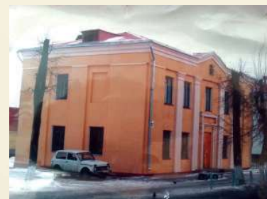
г. Шклов, ул. Советская, 151. Старое здание ОДО (1967–2000)