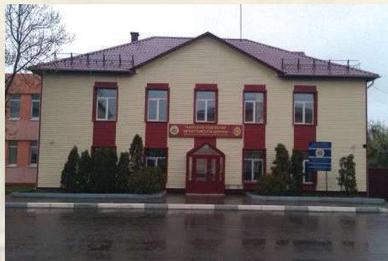
г. Чаусы, ул. Ленинская, 21