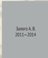
Залого А. В. 2011–2014