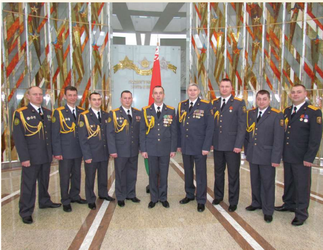
Торжественное мероприятие, посвященное 100-летию милиции Беларуси

Основным этапом исторического пути становления и развития управления по охране дипломатических представительств и консульских учреждений иностранных государств является август 1999 г., когда были подписаны Указ Президента Республики Беларусь № 470 от 14.08.1999 г. и приказ Министра внутренних дел Республики Беларусь № *27 от 18.08.1999 г., определившие создание управления в составе объединения «Охрана», с четко обозначенными задачами и функциями.