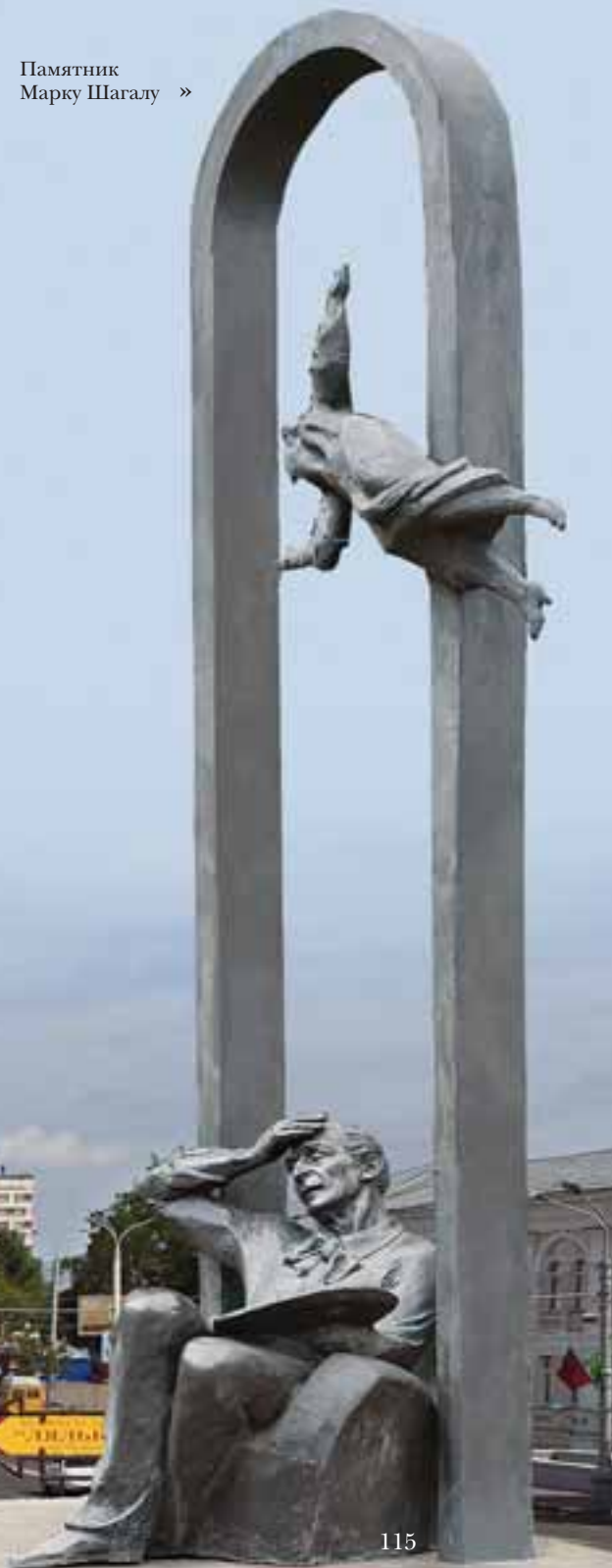
Памятник Марку Шагалу »

Александр Пушкин, Иван Лажечников, Иван Бунин, Владимир Маяковский, Глеб Успенский также имеют исторические связи с Витебской областью.