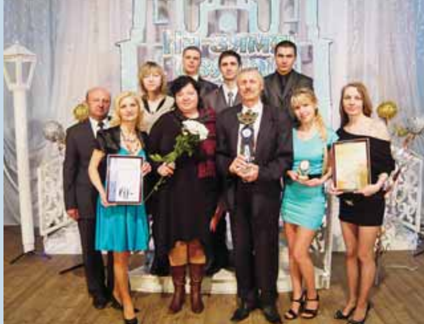
НВА «Виктория» – победители конкурса исполнителей белорусской песни «На зямлі святой Сафii», г. Полоцк

В 2012 году команда Витебского областного управления Департамента охраны МВД Республики Беларусь, следуя доброй спортивной традицией, вновь одержала победу в чемпионате Департамента охраны МВД Республики Беларусь по рукопашному бою и заняла призовое II место в смотре-конкурсе профессионального мастерства сотрудников Департамента охраны МВД Республики Беларусь.