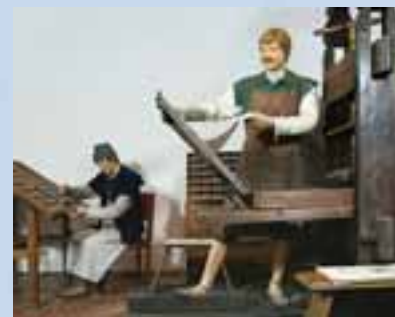
Полоцк. Музей книгопечатания

Витебск – областной административный центр. В состав области входят 21 район и 4 города областного подчинения.