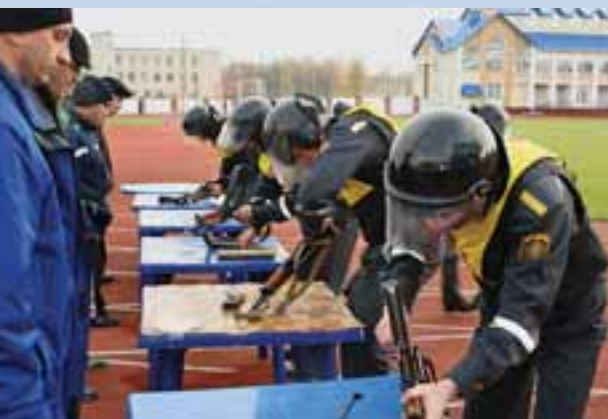
Не службой единой...

История Витебского областного управления Департамента охраны МВД Республики Беларусь начинается 29 октября 1952 года, когда на основании Постановления Совета Министров СССР № 4633-1835с «Об использовании работников в промышленности, строительстве и других отраслях народного хозяйства, высвобождающихся из охраны, и мерах по улучшению дела организации охра-