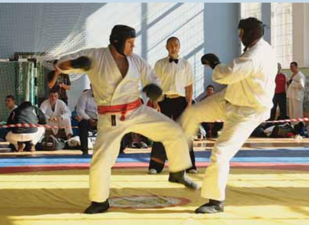
Чемпионат по рукопашному бою

С целью наиболее полного удовлетворения спроса граждан на охранные услуги, взятия под охрану нетелефонизированных