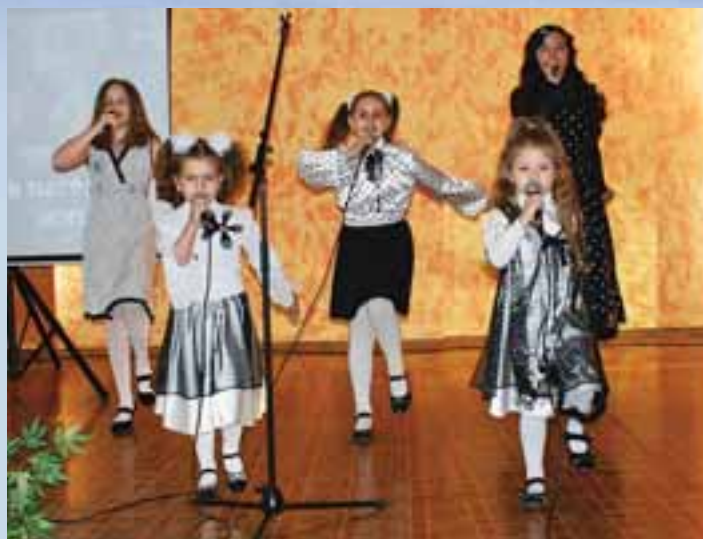
Детская эстрадная студия «Совушки»

В октябре 2012 года творческий коллектив Витебского областного управления Департамента охраны МВД Республики Беларусь принял участие в республиканском смотре-конкурсе художественной самодеятельности, где занял I место.