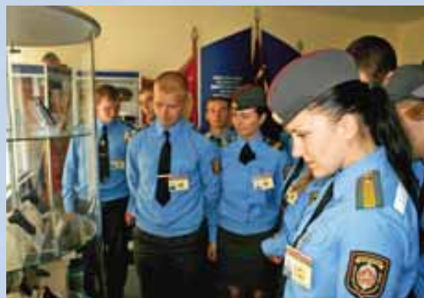
День молодого сотрудника

современную аппаратуру, кнопки тревожной сигнализации на объектах и в квартирах, осуществляют охрану телефонизированных и нетелефонизированных объектов, гарантируют выезд и своевременное прибытие групп задержания при срабатывании тревожной сигнализации, проводят обследование и подготовку предприятий, магазинов, офисов, квартир для приема под охрану с подключением на пульт централизованного наблюдения, обеспечивают вооруженное сопровождение грузов, денежных средств и физических лиц.