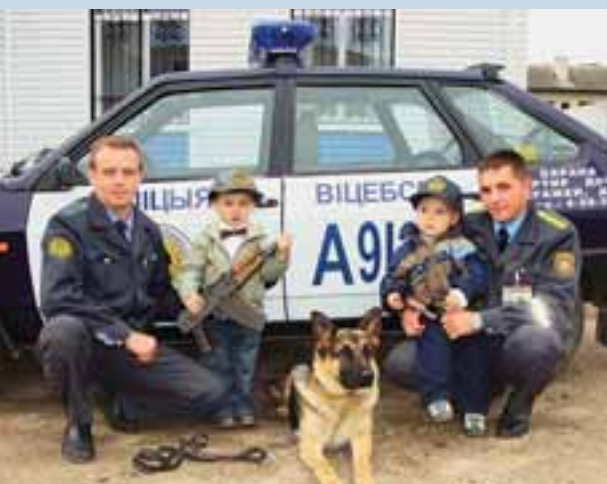
«Охрана – детям!»