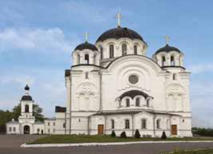
Полоцк. Кафедральный Крестовоздвиженский собор