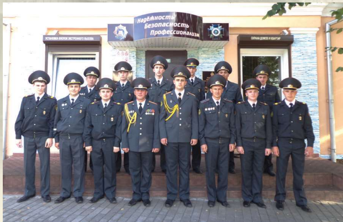
Служебный коллектив Чечерского ОДО