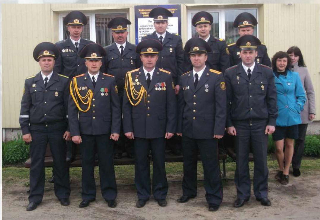
Служебный коллектив Хойникского ОДО