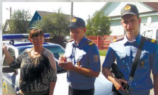
Группа задержания работает на месте происшествия