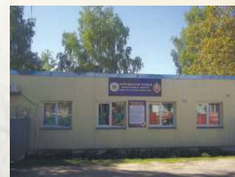
г. Хойники, ул. Граховского, 2