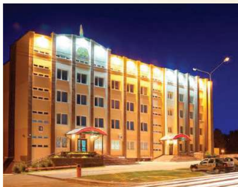
г. Гродно, пер. Дзержинского, 19