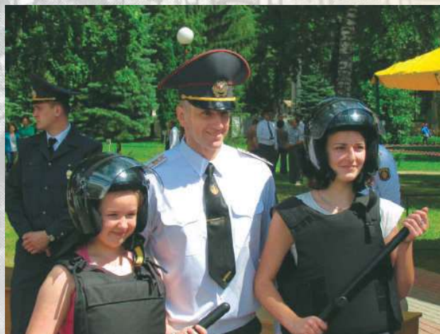
Акция «Спокойствие. Надежность. Безопасность»