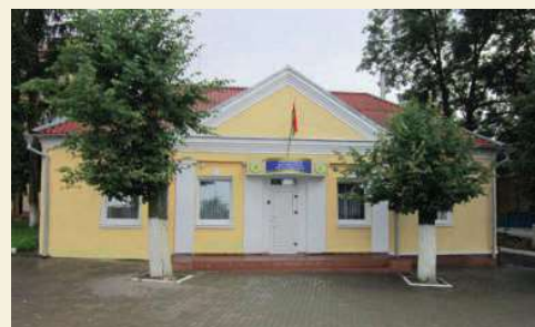
г. Чечерск, ул. Ленина, 7