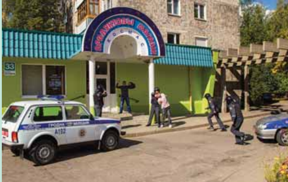
Задержание преступника сотрудниками Октябрьского (г. Гродно) отдела охраны