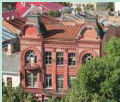
Хоральная синагога в Гродно – одна из четырех действующих в Беларуси