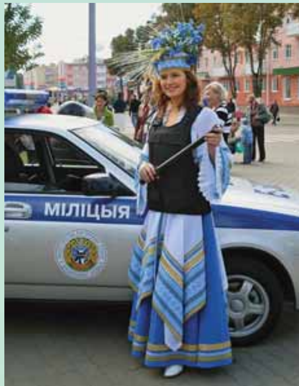
«Дажынкi -2010» – под надежной охраной!

ния общественной безопасности и защиты общества от преступных посягательств. И сегодня сотрудники подразделений охраны области несут службу в условиях сложной оперативной обстановки. Независимо от трудности, ежедневно рискуя жизнью и здоровьем, они проявляют лучшие профессиональные и человеческие качества, мужество, бдительность, остаются верными присяге и традициям, заложенным старшими поколениями солдат правопорядка, своим трудом обеспечивают надежную защиту конституционных основ государства, поддержание порядка и стабильности в обществе, личную и имущественную безопасность граждан, спокойствие и уверенность в завтрашнем дне.