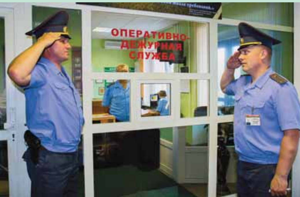
Смена наряда в оперативно-дежурной службе управления

Азот», управление Национального банка по Гродненской области, Гродненский областной исполнительный комитет, районные исполнительные комитеты, объекты жизнеобеспечения и массового пребывания граждан. Объекты охраняются не только путем выставления поста милиции, но и