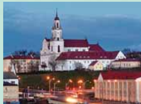
Бернардинский костел в Гродно

Гродно – областной административный центр. В состав области входит 17 районов, 12 городов, в том числе 6 – областного подчинения, 21 поселок городского типа.