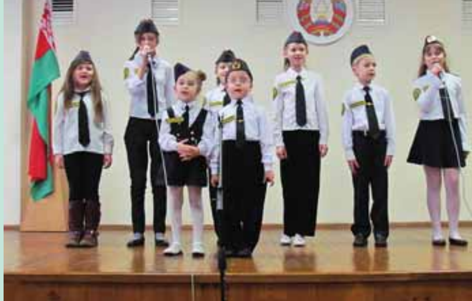
Участники детской студии эстрадного пения

«Охрана – служба лучшая в милиции, дружный коллектив, в котором хочется работать!»