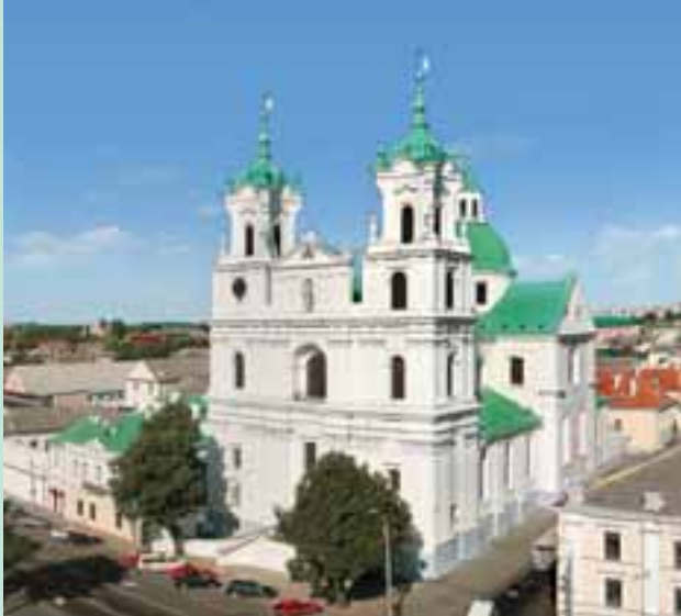
Фарный костел Св. Франциска Ксаверия