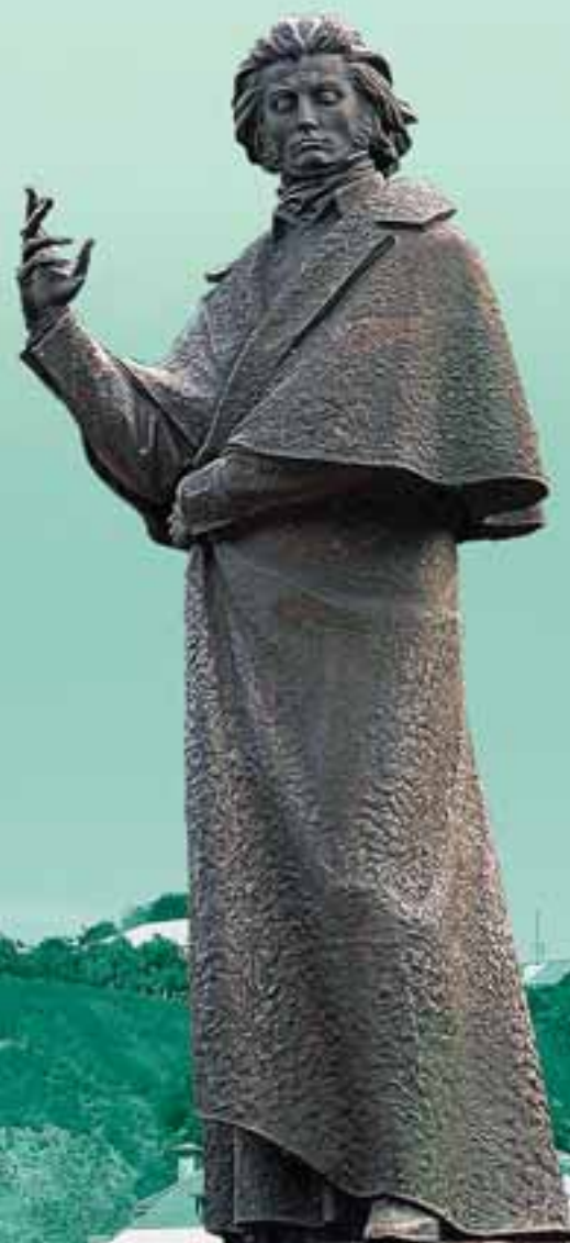
Памятник Адаму Мицкевичу на родине поэта, в Новогрудке