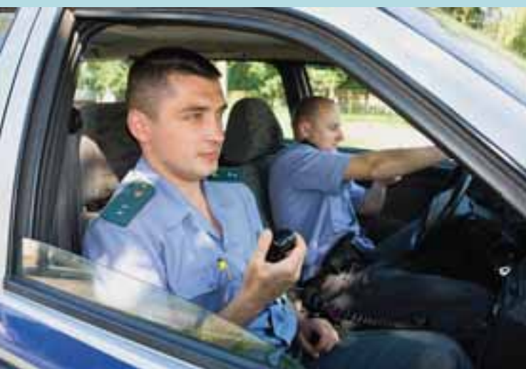
Группа задержания Железнодорожного (г. Гомеля) отдела Департамента охраны на маршруте патрулирования

республиканского значения как «Белорусский металлургический завод» (г. Жлобин), «Целлюлозно-картонный комбинат» (г. Светлогорск), «Молочно-консервный комбинат» (г. Рогачев), «Белорусский газоперерабатывающий завод» (г. Речица), Белорусский нефтеперерабатывающий завод (г. Мозырь), дворцово-парковый ансамбль Румянцевых – Паскевичей (г. Гомель) и многие другие. Это свидетельствует о доверии организаций и предприятий опыту и профес-