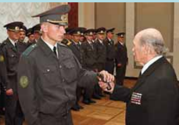
Торжественное вручение молодому сотруднику Светлогорского отдела охраны табельного оружия ветераном ОВД

поставленными задачами. В настоящее время в структуру охраны Гомельщины входит 10 отделов, 10 отделений охраны, отдельная рота милиции и питомник служебных собак. Подразделениями охраны области обеспечивается охрана на договорной основе более 34 000 объектов различных форм собственности, из которых более 29 000 помещений с личным имуществом граждан. Охрану своей собственности нам доверили такие важные объекты