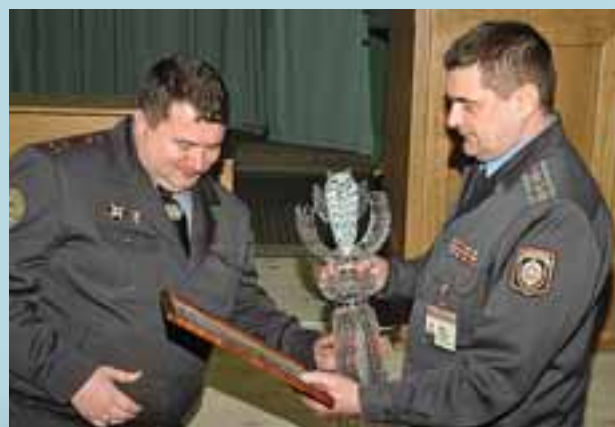
Вручение «Хрустальной совы» начальнику Гомельского областного управления Департамента охраны

охраны Гомельщины удостоивался «Хрустальной совы» и Диплома первой степени, которые символизируют профессионализм каждого сотрудника и всего боль-