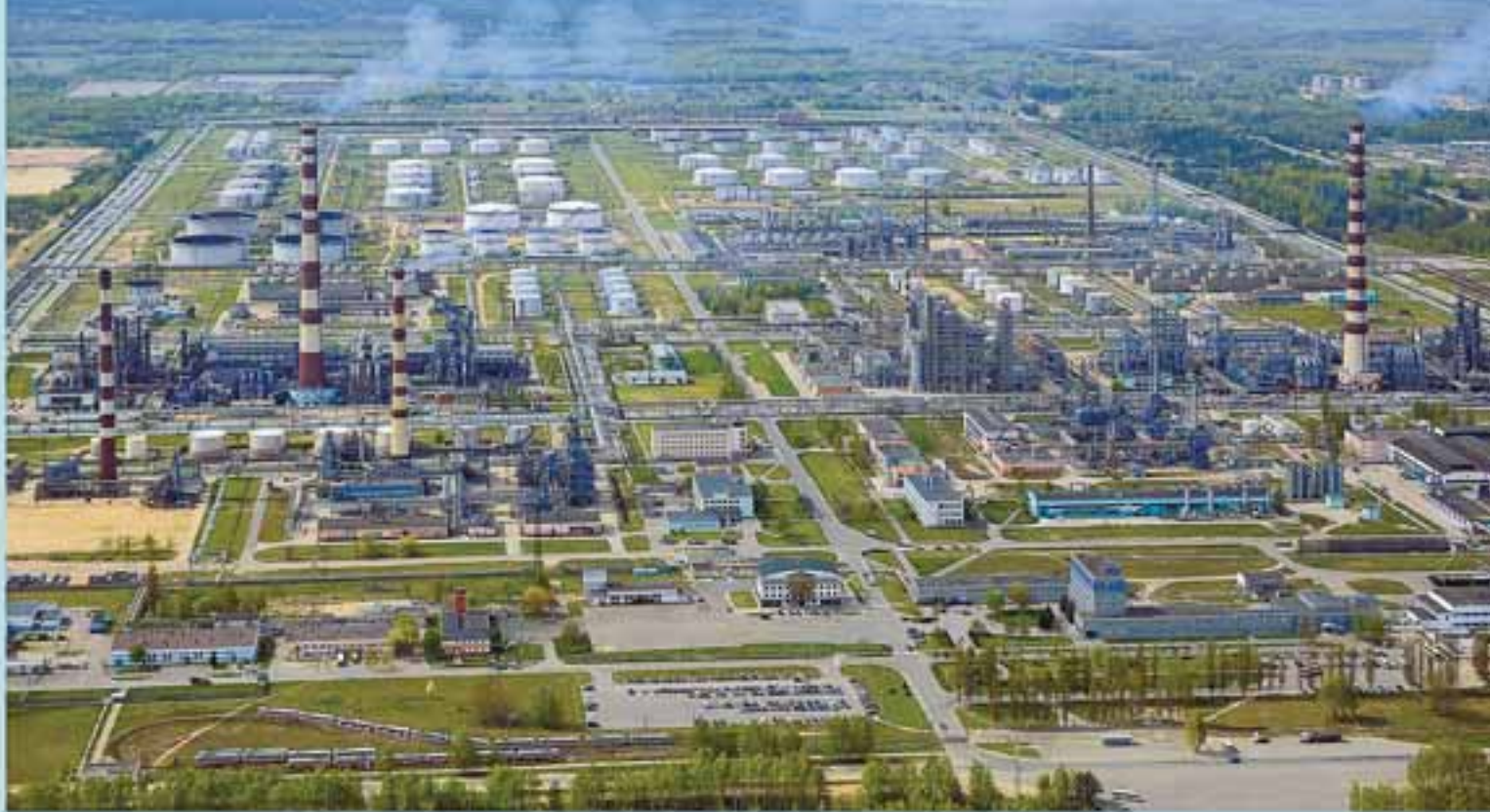
Мозырский нефтеперерабатывающий завод

В Ельском районе обнаружено месторождение горючих сланцев.