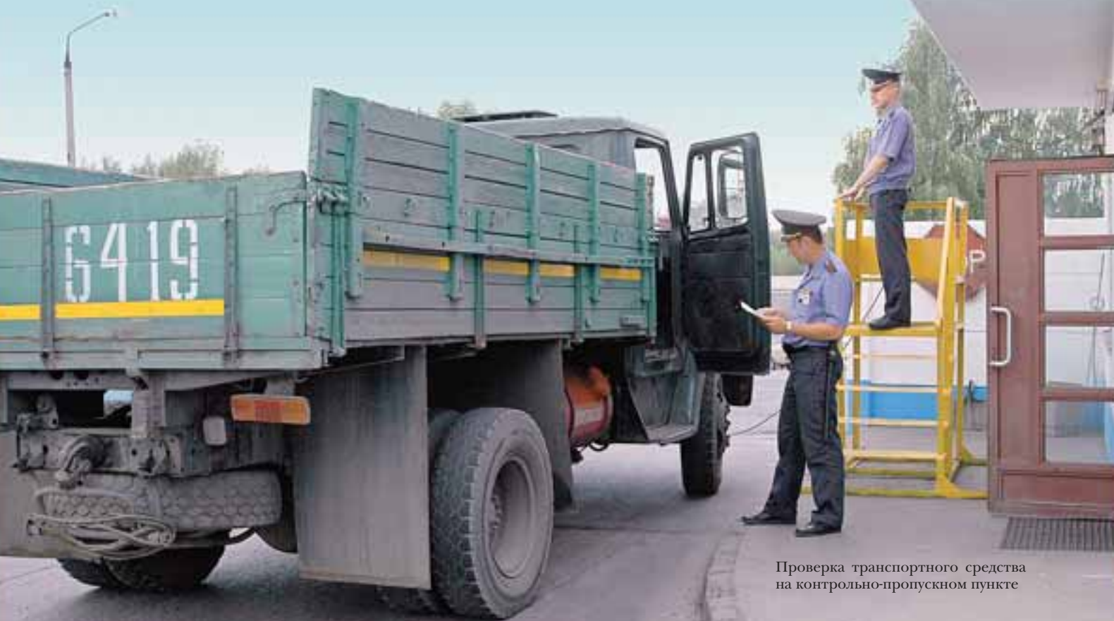
Проверка транспортного средства на контрольно-пропускном пункте