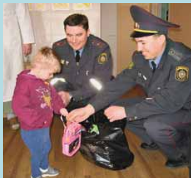
Посещение сотрудниками Гомельского областного управления Департамента охраны Дома ребенка

В целях создания наиболее оптимальных и эффективных условий труда нашего персонала постоянно проводится работа по созданию современной эффективной материально-технической базы. Так, только в период с 2009 г. на территории Новобелицкого района города Гомеля был торжественно открыт питомник служебных собак, введены в эксплуатацию новые административные здания в Калинковичском и Лель-