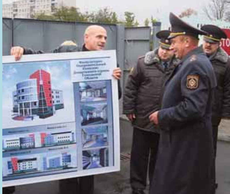
Согласование проекта на строительство физкультурно-оздоровительного комплекса Гомельского областного управления Департамента охраны МВД Республики Беларусь

республиканского значения как «Белорусский металлургический завод» (г. Жлобин), «Целлюлозно-картонный комбинат» (г. Светлогорск), «Молочно-консервный комбинат» (г. Рогачев), «Белорусский газоперерабатывающий завод» (г. Речица), Белорусский нефтеперерабатывающий завод (г. Мозырь), дворцово-парковый ансамбль Румянцевых – Паскевичей (г. Гомель) и многие другие. Это свидетельствует о доверии организаций и предприятий опыту и профес-