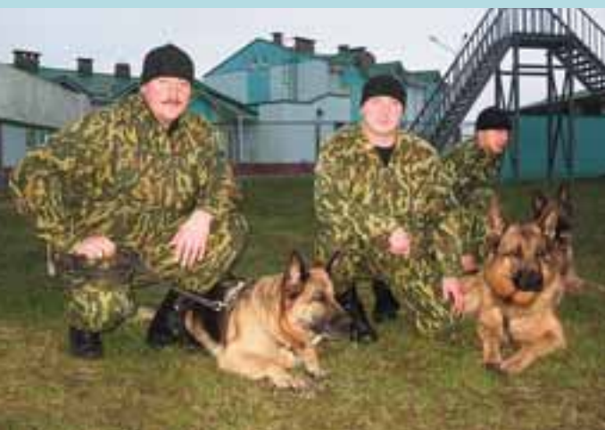
Милицейеры-кинологи со своими питомцами на занятиях в питомнике служебных собак Гомельского областного управления Департамента охраны МВД Республики Беларусь