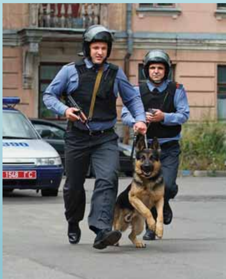
Группа задержания Центрального (г. Гомеля) отдела Департамента охраны